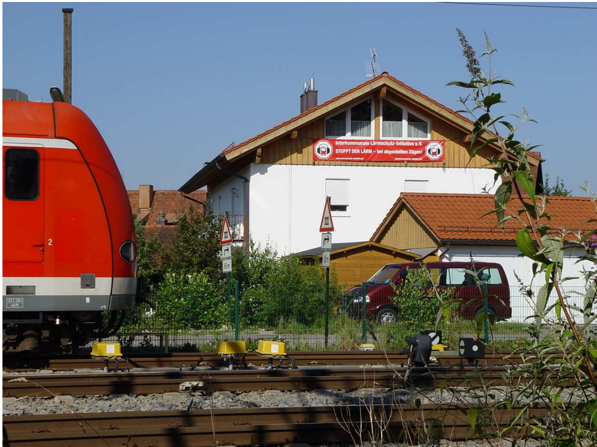
Gleis 23, Sauerlacher Strasse

schmerzhafteste Lärmemissions-Problem für zahlreiche Gemeinden im Münchener S-Bahn Bereich dar.